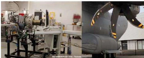
Site SARREAN Power Units - Toulouse