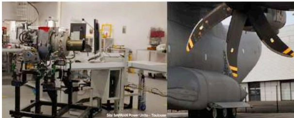
Site SARFAI Power Units - Toulouse